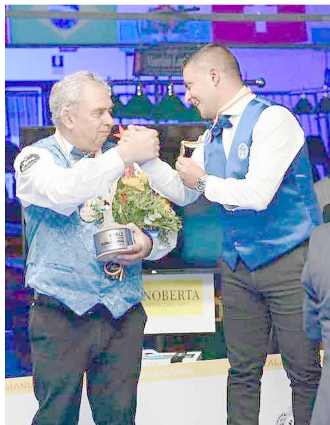
La última gran actuación de Ricardo fue entonces en el Mundial 2022 de Calangianus, en Italia, donde obtuvo el subcampeonato.

- Y en cuanto a mi retiro, es un tema que venía estudiando desde hace un año. Desde principios de 2024 me había propues-